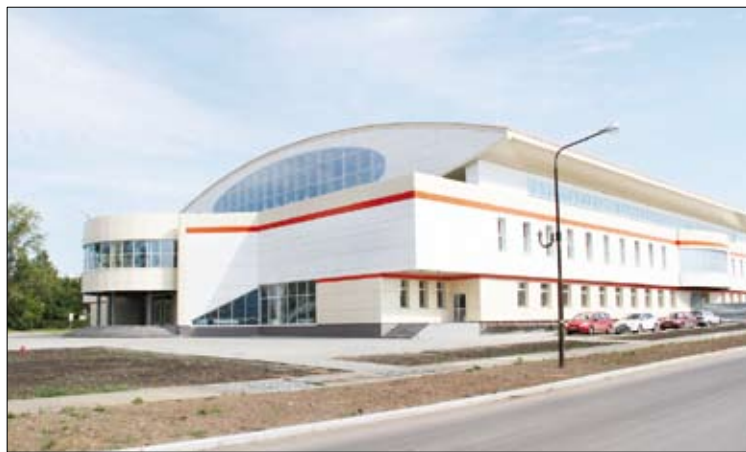
Наша Ледовая арена, как с обложки канадского журнала.