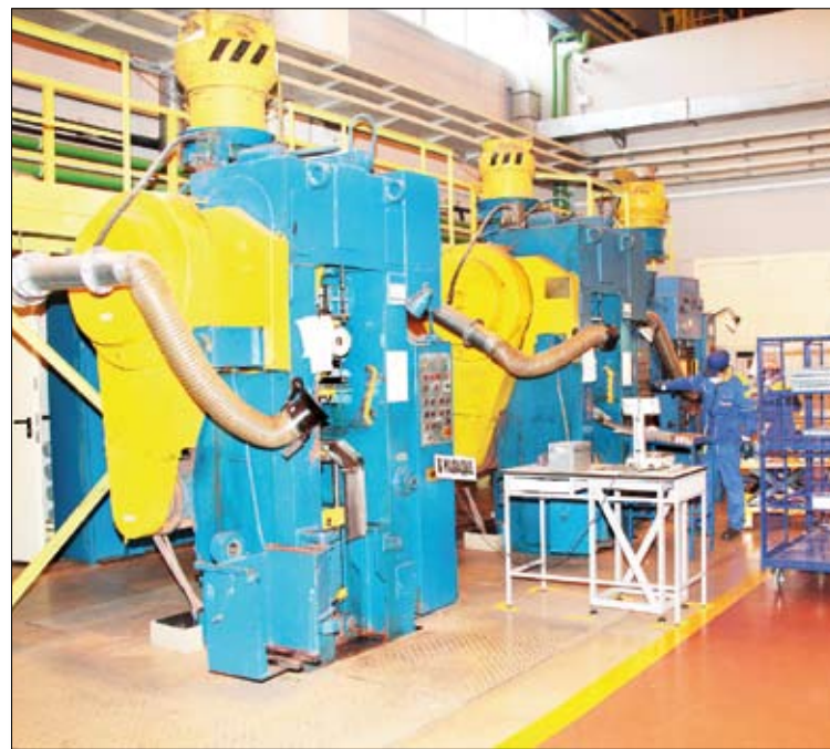
В новом помещении ЦППИ и условия труда стали значительно лучше.

труда, на 7,2 процента увеличился фонд оплаты труда.