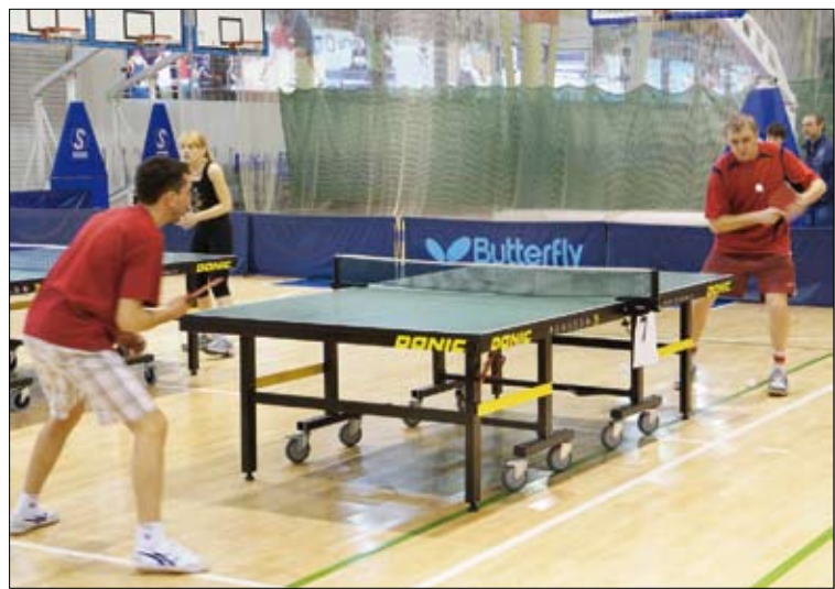
Сборную УПР начинают бояться соперники из других подразделений третьей группы!

БОЛЬШОЙ ЗАЛ ул. Чистова, 2. Касса: 5-47-13