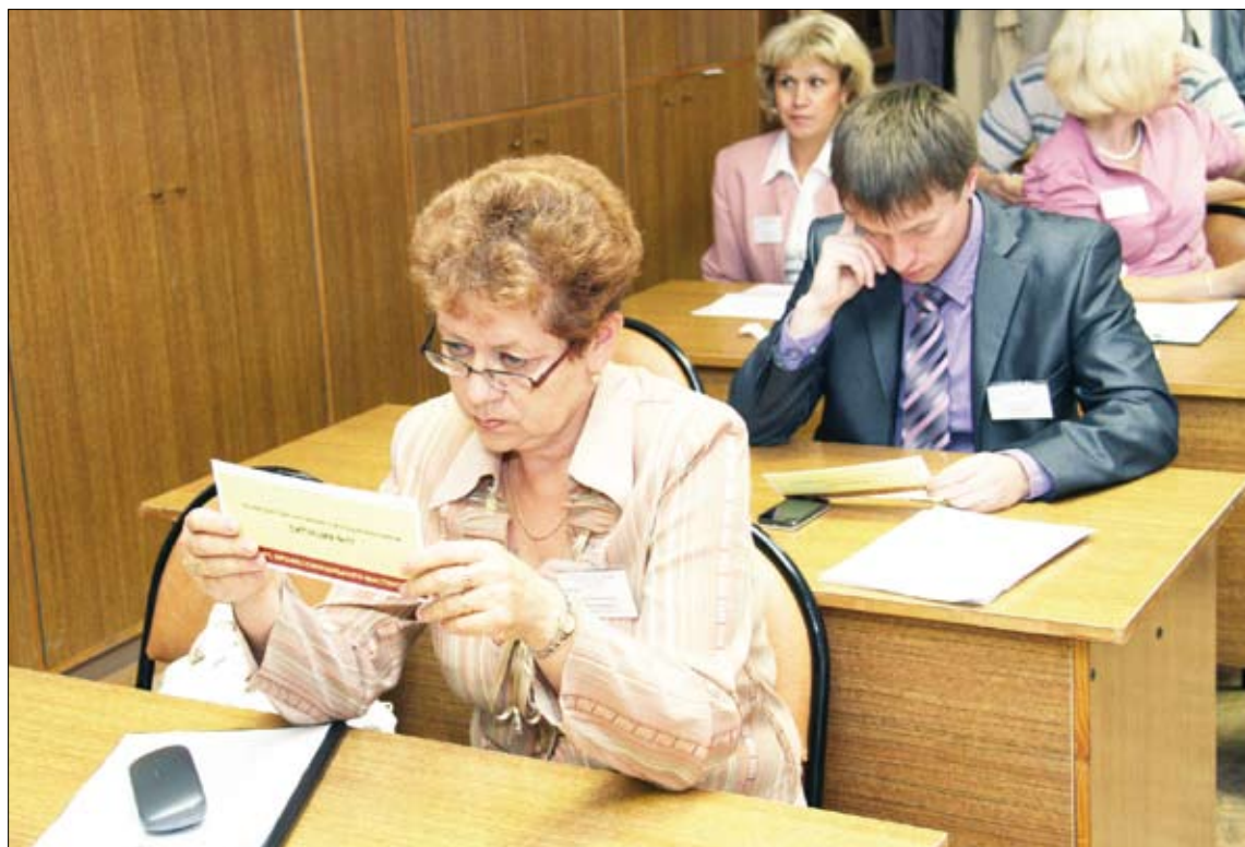
На конкурсе трудно, как на экзамене.