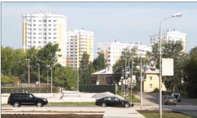
Одно из преимуществ Верхней Пышмы – обилие зелени.