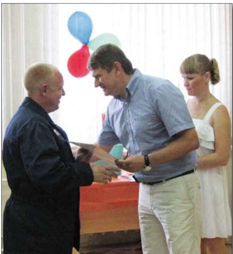
В МПЦ не скупятся на добрые слова в адрес хороших работников.